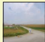
Heidemarie Z-Carnelid Digital Fine Art