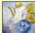
Anita Riccius Olja & Akvarell